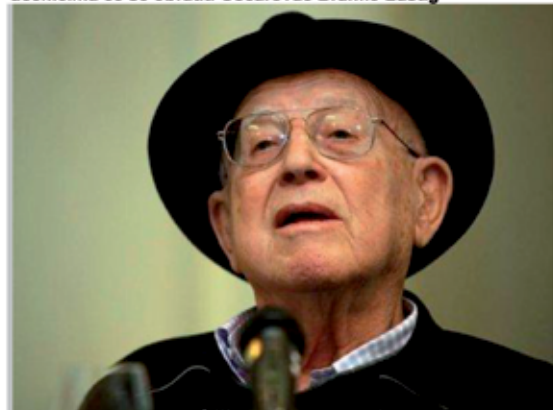
Festival predvodi gospodin Branko Lustig, dvostruki dobitnik prestižne filmske nagrade Oscar

Edukacijsko jutro predviđa projekciju filma Dječak u prugastoj pidžami, a nakon filma učenicima će se obratiti Oscarovac Branko Lustig